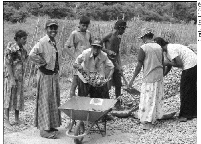
Construyendo un puente luego del-Tsunami en Sri Lanka

Aquí los artículos contrastan lo aprendido del huracán Mitch en 1998 y del ciclón Orissa en 1999, con los enfoques que han surgido hoy después del tsunami en Sri Lanka, y examinamos la capacidad del sector transporte para equilibrar su concienciación en temas sociales y en la planificación a largo plazo para la sostenibilidad con la necesidad de actuar inmediatamente. Este Noticias del Foro concluye dando una mirada nuevamente a la propuesta de una red de Acceso durante una Emergencia. ¿Puede éste proporcionar los medios para asegurar que la respuesta inmediata del sector transporte lleve consigo lo aprendido del pasado?